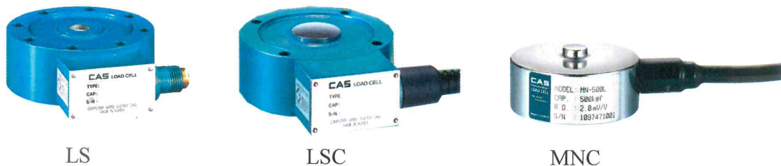
Рисунок 1 – Общий вид датчиков

Вид нагрузки датчиков – растяжение-сжатие (LS), сжатие (LSC, MNC). Датчики LS и LSC изготавливаются из прокатной стали, датчики MNC – из нержавеющей либо окрашенной стали.